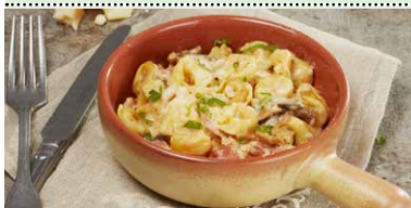
TORTELLINI AL FORNO