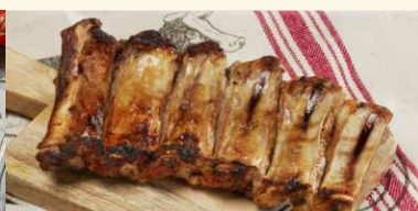
COASTA DE VITEL LA GRATAR