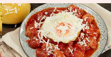
TOCHITURA CU MAMALIGUTA