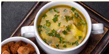
SUPA DE PUI