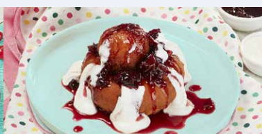
PAPANASI CU DULCEATA DE VISINE