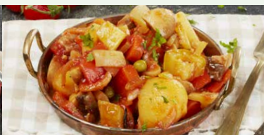
TOCANITA CU LEGUME