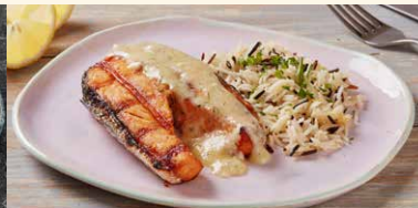
SOMON CU SOS DE LAMAIE