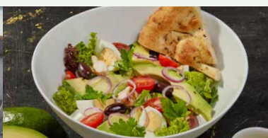
SALATA DE PUI CU AVOCADO