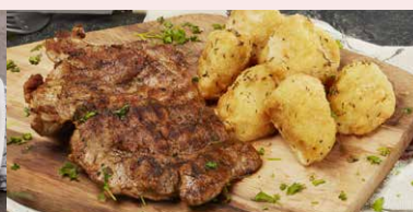
PASTRAMA DE PORC