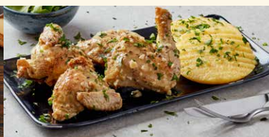
COCOSUL LA CEAUN