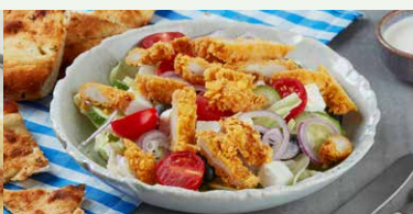
SALATA CRISPY CHICKEN