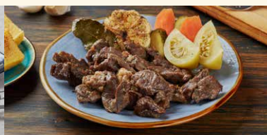
PASTRAMA DE BERBECUT LA CEAUN