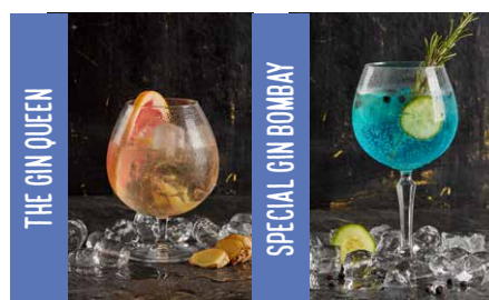
THE GIN QUEEN