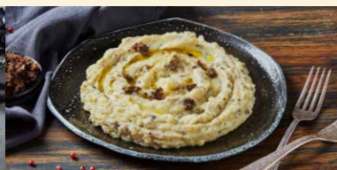
PIURE CU TRUFE