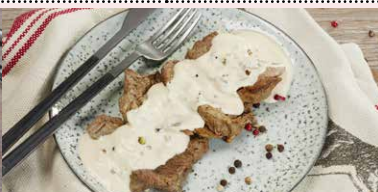
MUSCHI DE VITA CU SOS DE PIPER