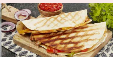
QUESSADILLA CU PULPA DE PUI