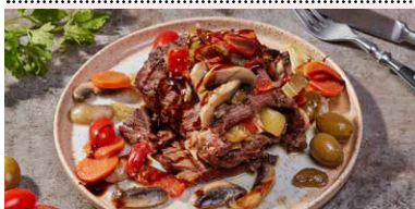
MUSCHI DE VITA CU SOS DE MASLINE VERZI