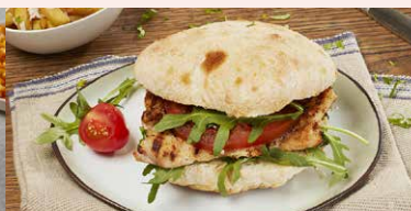
SANDWICH ROVI'S CU PIEPT DE PUI