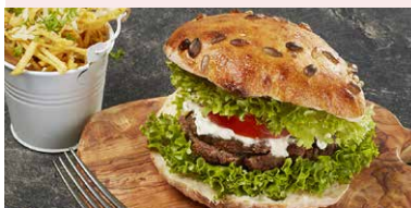
ROVI'S BURGER DE VITA