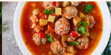
CIORBA DE PERISOARE