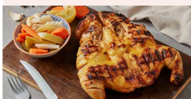
COCOSUL DE PADURE LA GRATAR