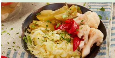
SALATA DE MURATURI