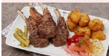
COTLET DE BERBECUT