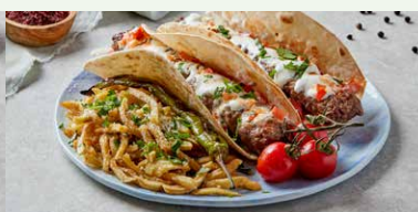
ADANA KEBAP IN LIPIE