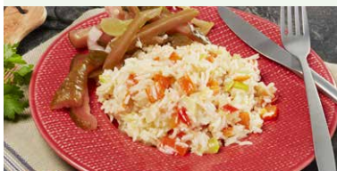
OREZ CU LEGUME