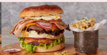
DUBLU ROVI'S BURGER DE VITA