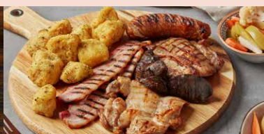
PLATOU CALD (2 PERSOANE)