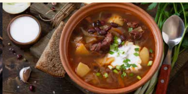
CIORBA DE VACUTA