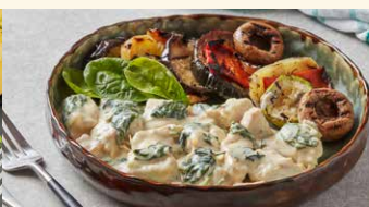
PUI FLORENTIN CU SPANAC