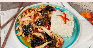
PUI CU URECHI DE LEMN