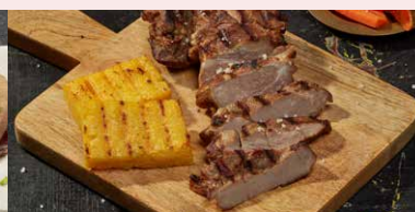
PASTRAMA DE BERBECUT