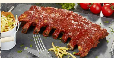
COASTA DE PORC CU SOS BBQ