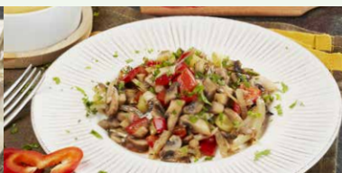
SOTE DE CIUPERCI CU MAMALIGUTA