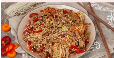
TERIYAKI CU VITA