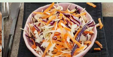
SALATA DE VARZA CU MAIONEZA