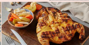
COCOSUL DE PADURE LA GRATAR