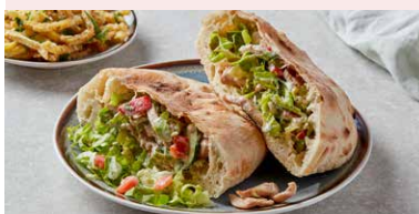
FAJITAS DE PUI