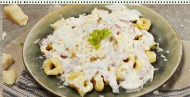
TORTELLINI ALLA PANNA