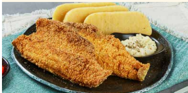
PASTRAV PRAJIT CU MAMALIGUTA