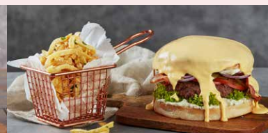
MEGA CHEESE BURGER