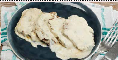
MUSCHI DE VITA CU SOS GORGONZOLA