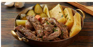
PASTRAMA DE PORC LA CEAUN