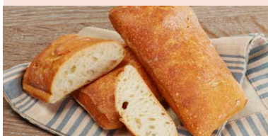
CIABATTA (PAINE DE CASA)