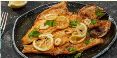
DORADA LA CUPTOR