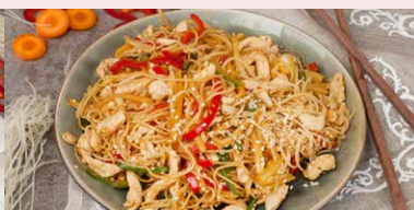
TERIYAKI CU PUI