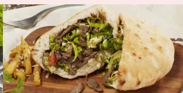
FAJITAS DE VITA