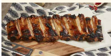
COASTA DE PORC LA GRATAR