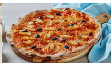
PIZZA CRISPY CHICKEN