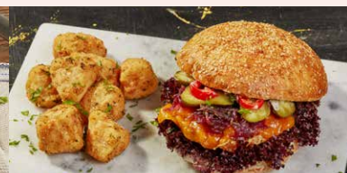
FUNKY PORK SANDWICH