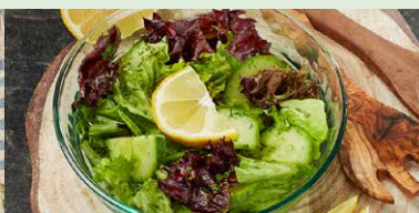
SALATA VERDE CU LAMAIE