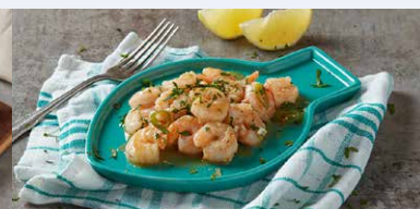
CREVETI CU USTUROI SI VIN