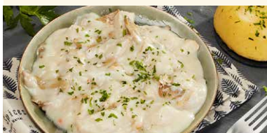
CIULAMA DE PUI CU CIUPERCI SI MAMALIGUTA