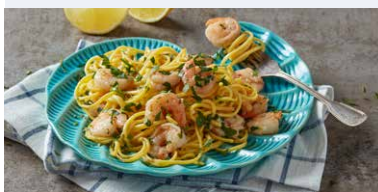
PASTE CU CREVETI